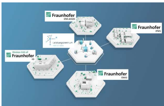
Das Leistungszentrum Mikro/Nano bündelt Kompetenzen der vier Kerninstitute Fraunhofer IPMS, ENAS, IIS/EAS und IZM-ASSID