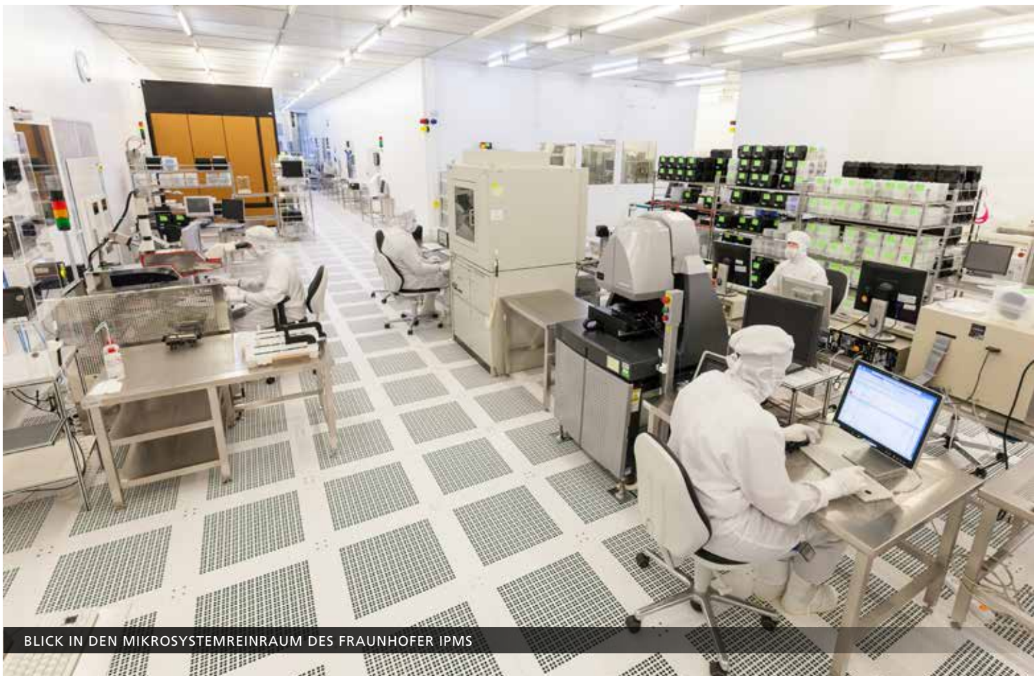
BLICK IN DEN MIKROSYSTEMREINRAUM DES FRAUNHOFER IPMS

Die wichtigsten Forschungs- und Entwicklungspartner des Fraunhofer IPMS sind bereits auf die 200-mm-Technologie umgestiegen. Durch die einheitliche Wafergröße kann zukünftig die notwendige Arbeitsteilung in der Prozessierung realisiert werden, was eine weitere Miniaturisierung und Funktionsintegration ermöglicht. Mit den bereit gestellten Mitteln schafft das Institut bis 2017 eine moderne Forschungsbasis um für nationale und internationale Partner weiterhin ein innovativer Forschungs- und Entwicklungsdienstleister zu bleiben.